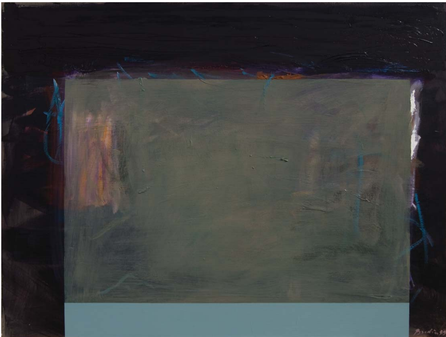
AKVARIJ, 1999. akrilik na platnu, 91,2x121,7 cm