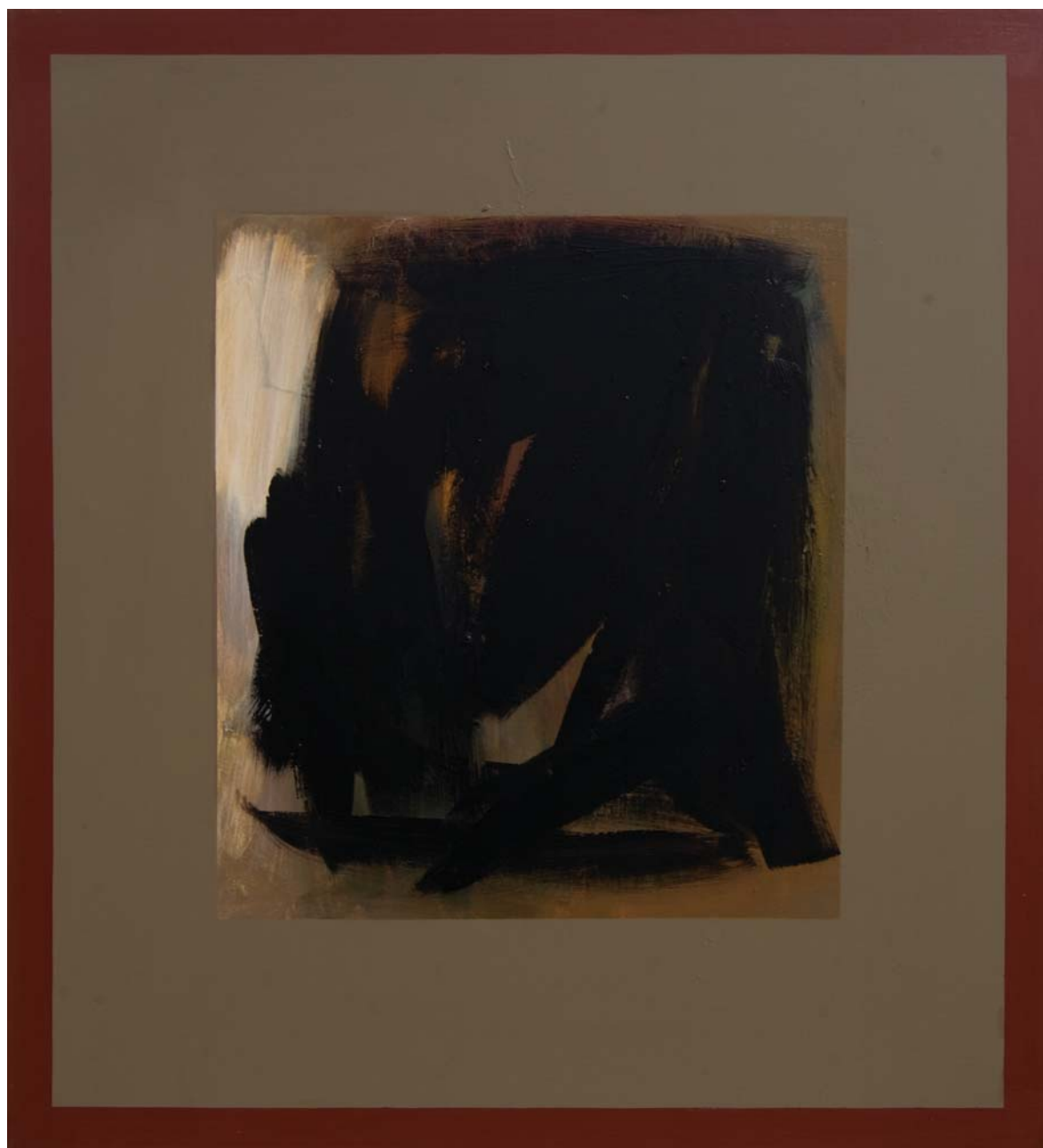
SIMFONIJA U CRNOM, 1998. akrilik na platnu, 111,8x101,6 cm