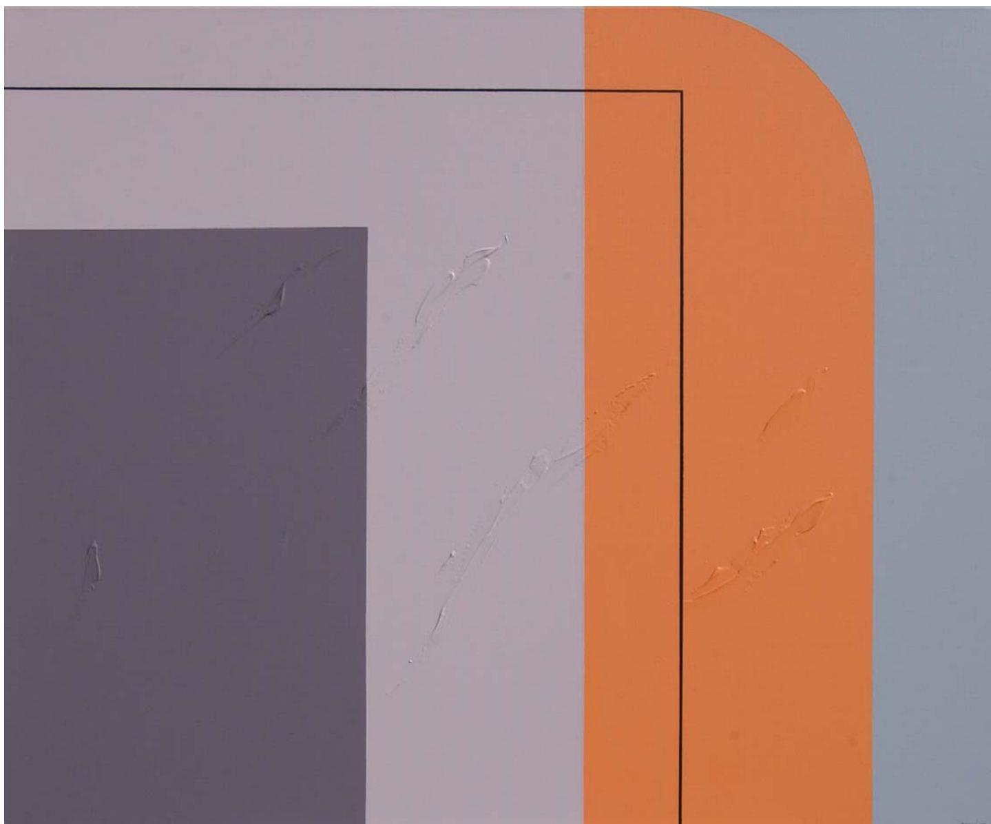
RAZIGRANOST, 2007. akrilik na platnu, 100x120 cm