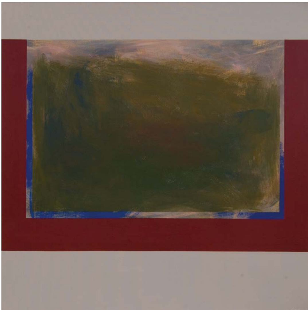
BEZ NASLOVA, 1998. akrilik na platnu, 121,9x121,9 cm