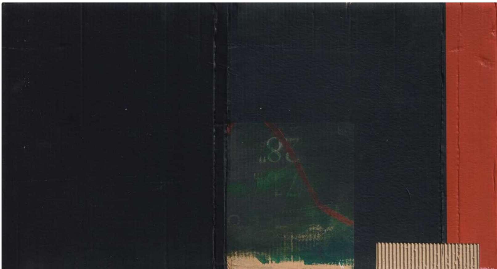
BROJ 28, 2006. akrilik na ljepenci, 47,1x48,8 cm