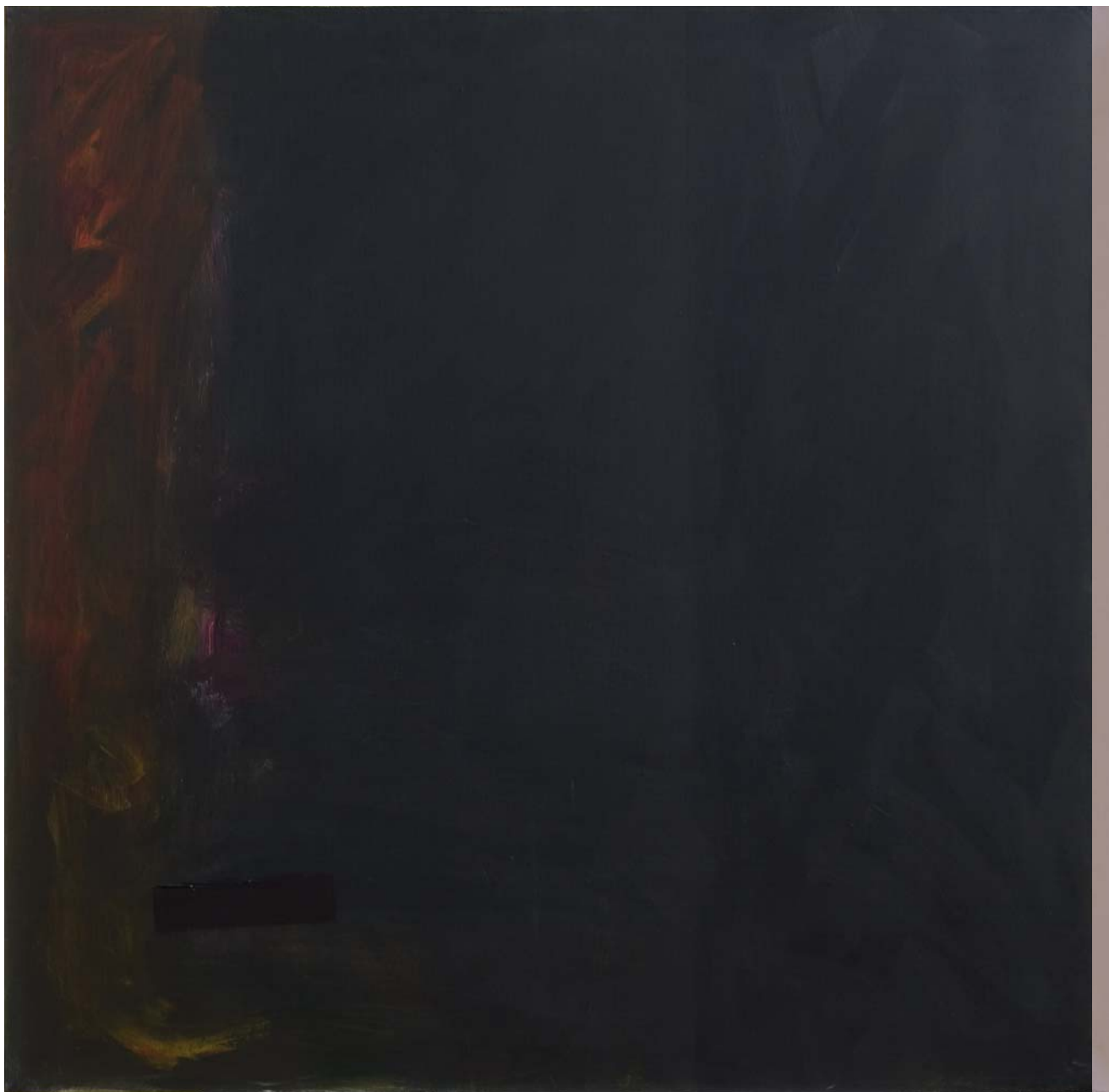
KOMPOZICIJA 28 (DIPTIH), 1999. akrilik na platnu, 101,6x203,2 cm