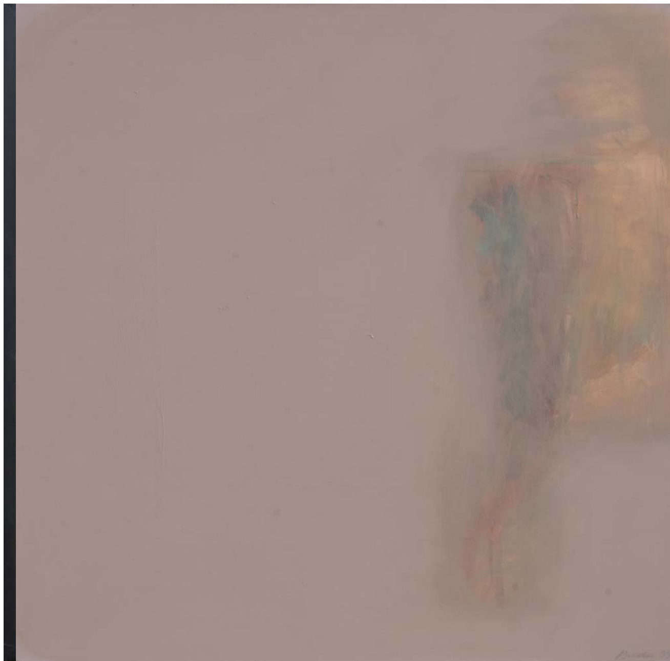
KOMPOZICIJA 28 (DIPTIH), 1999. akrilik na platnu, 101,6x203,2 cmakrilik na platnu, 116x90 cm