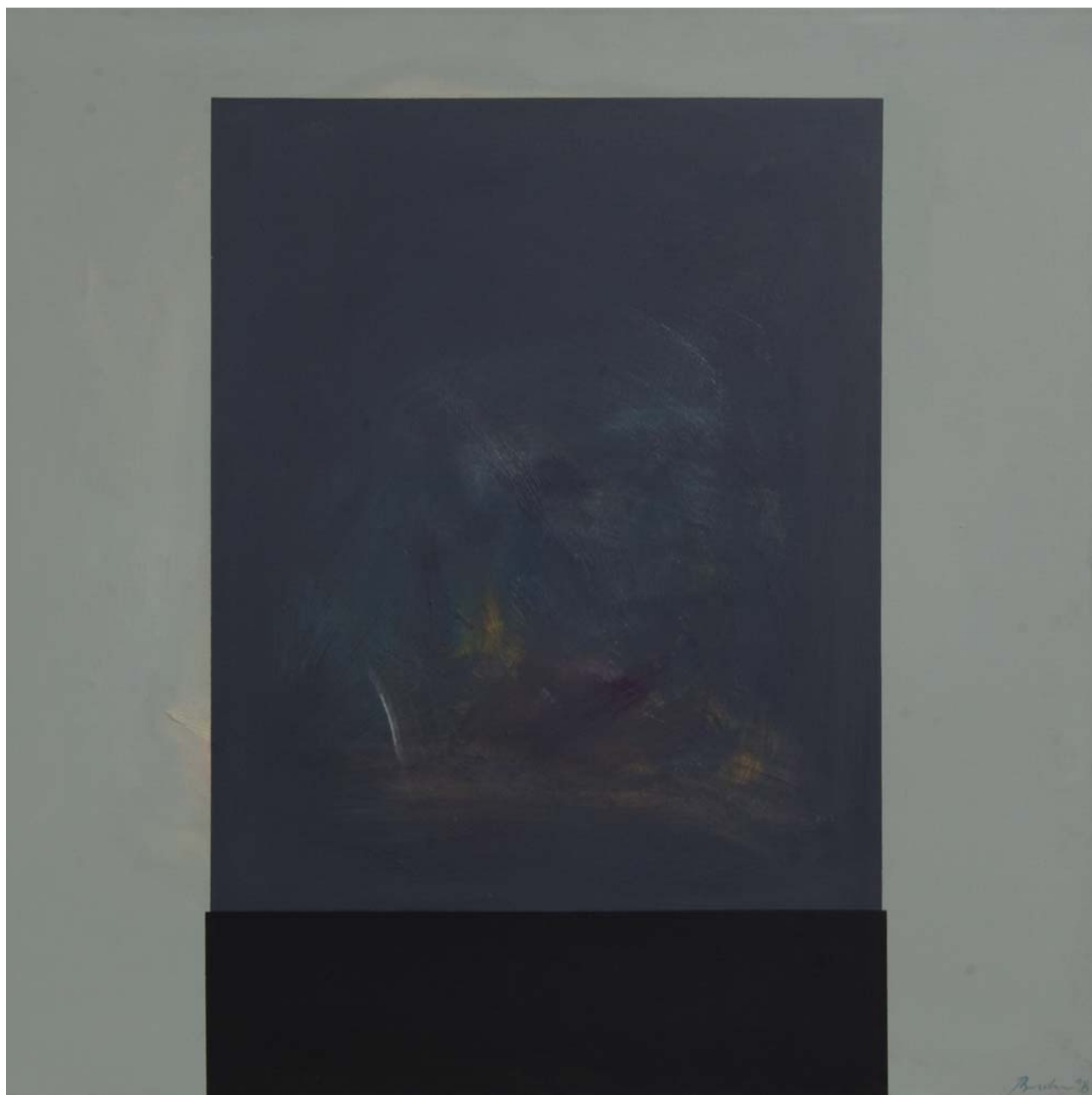
OBELISK , 1998. akrilik na platnu, 101,5x101,5 cm