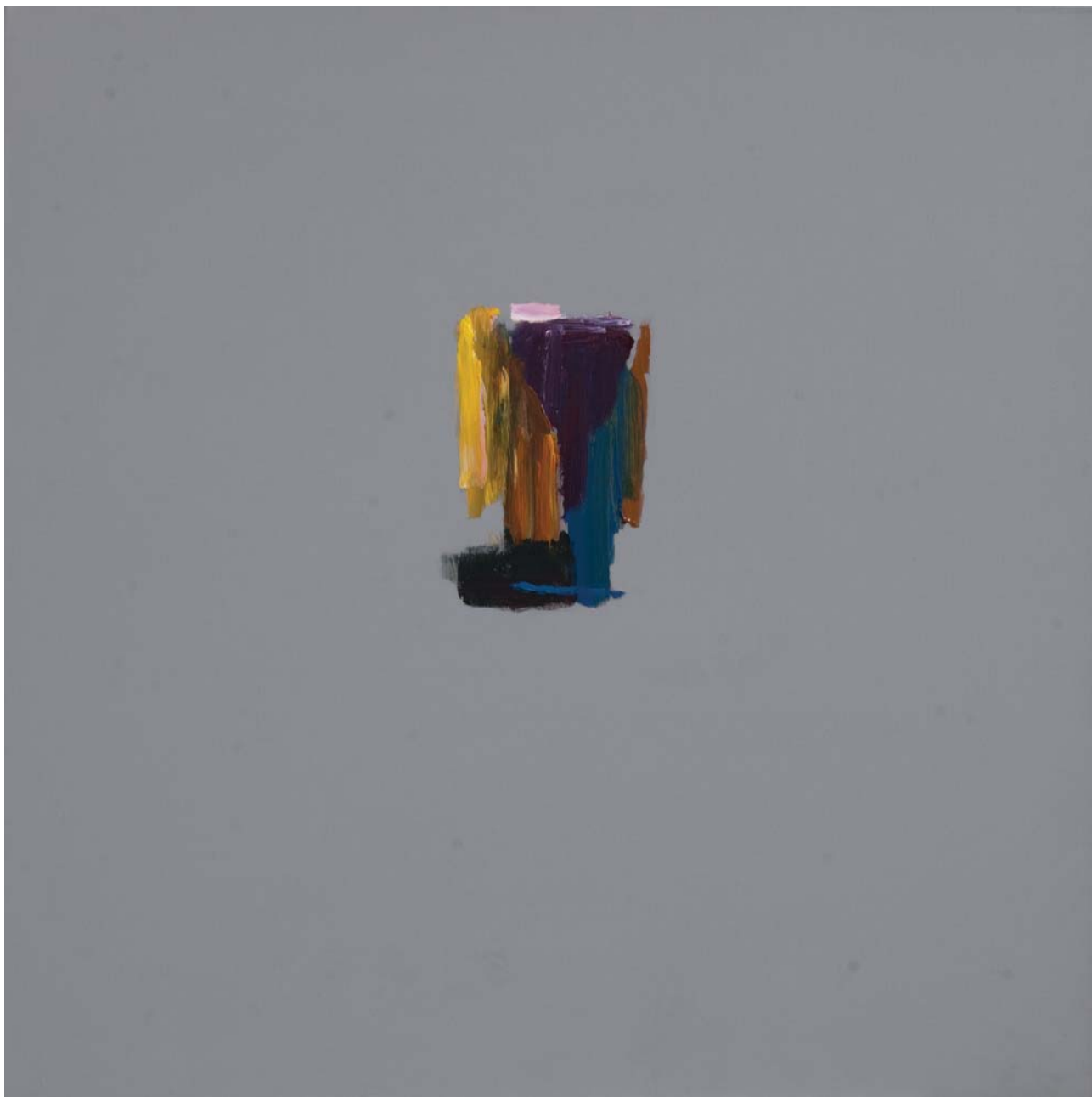
BEZ NASLOVA, 1999. akrilik na platnu, 101,6x101,6 cm