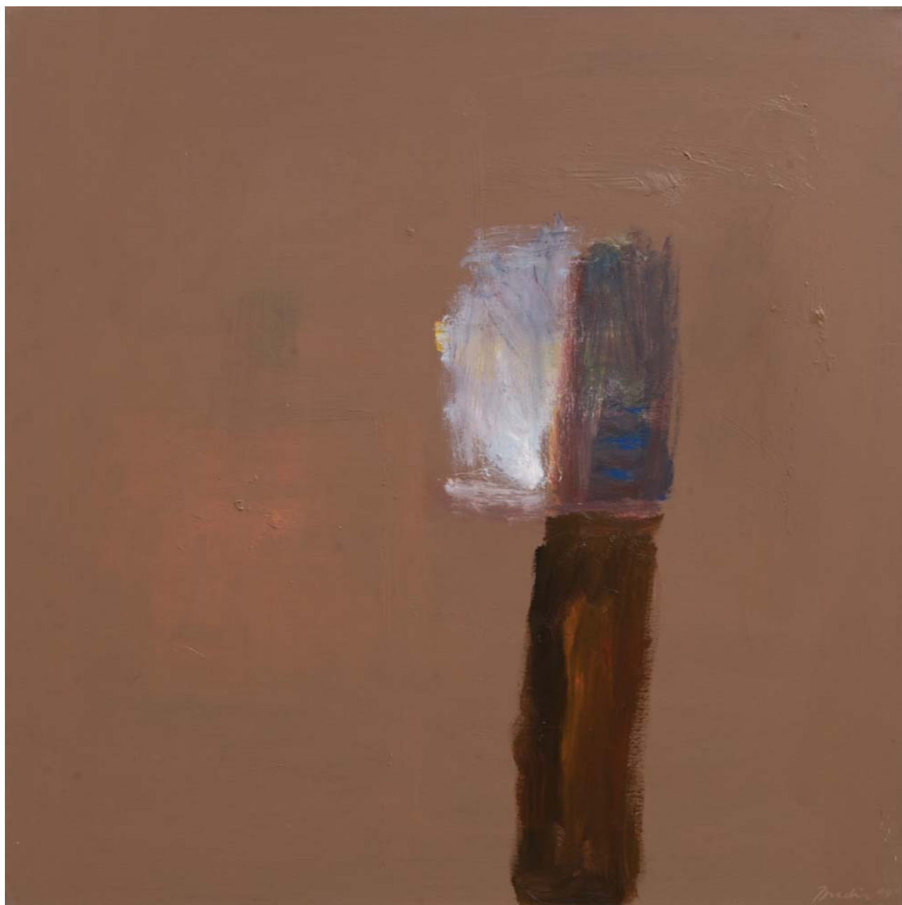
BEZ NASLOVA , 1999. akrilik na platnu, 102x102 cm