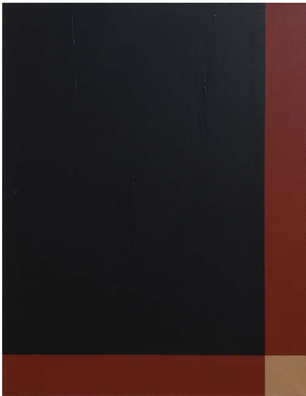
BEZ NASLOVA , 2006. akrilik na platnu, 116x90 cm