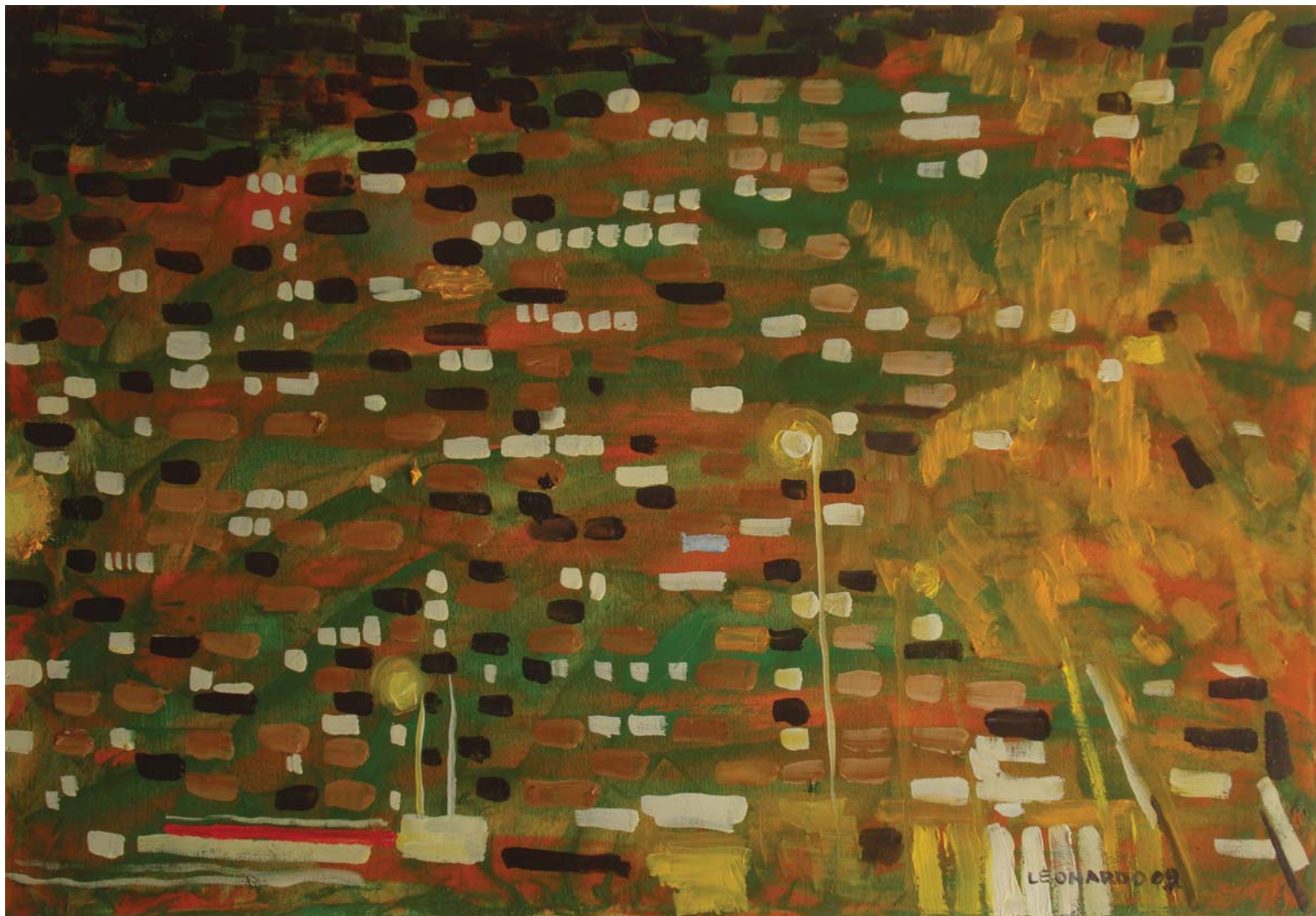
PROZORI MAMUTICE, 2009. ulje na platnu, 50x70 cm