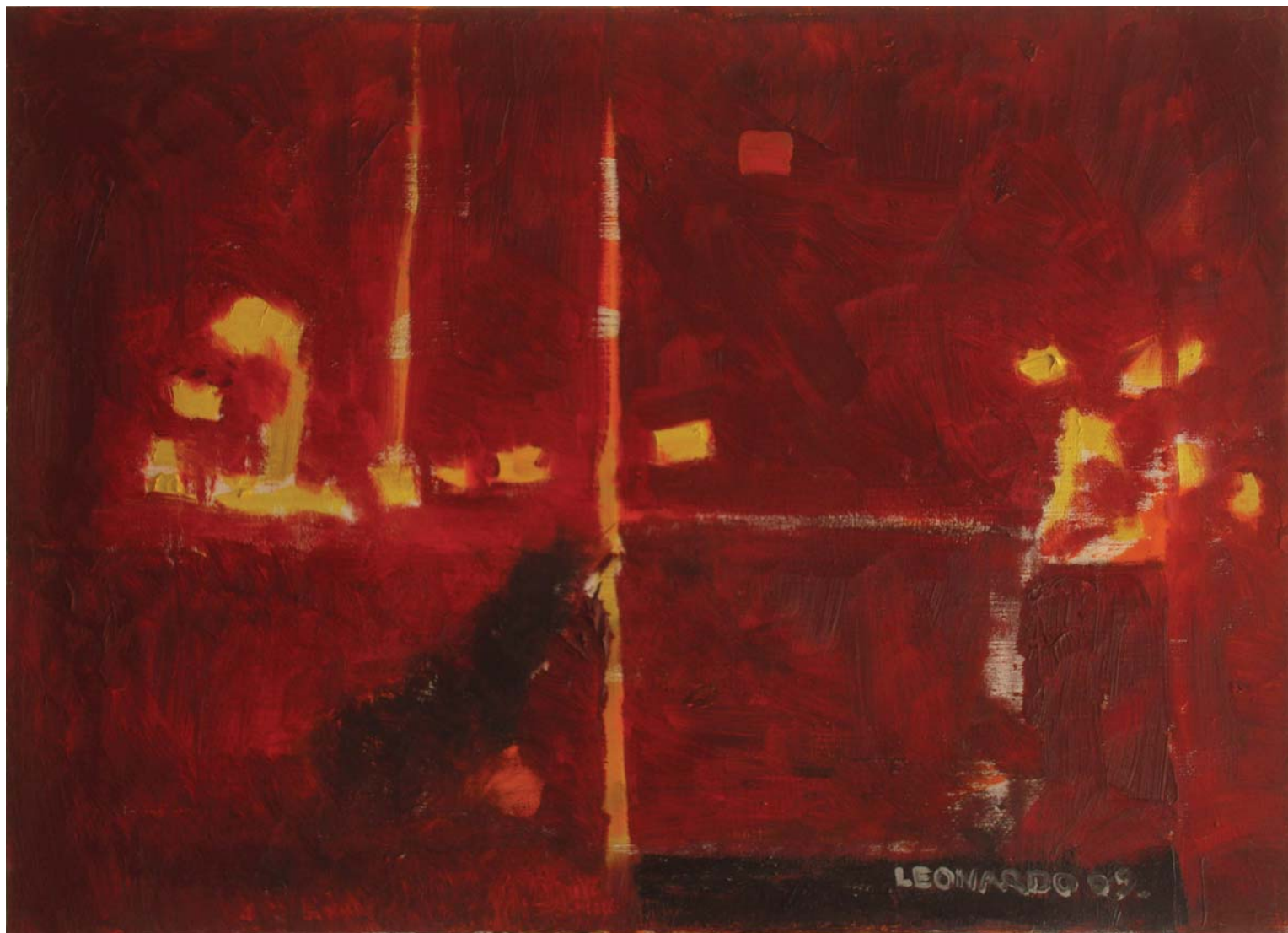
OKOMICA U TRAVNOM, 2009. ulje na platnu, 40x50 cm