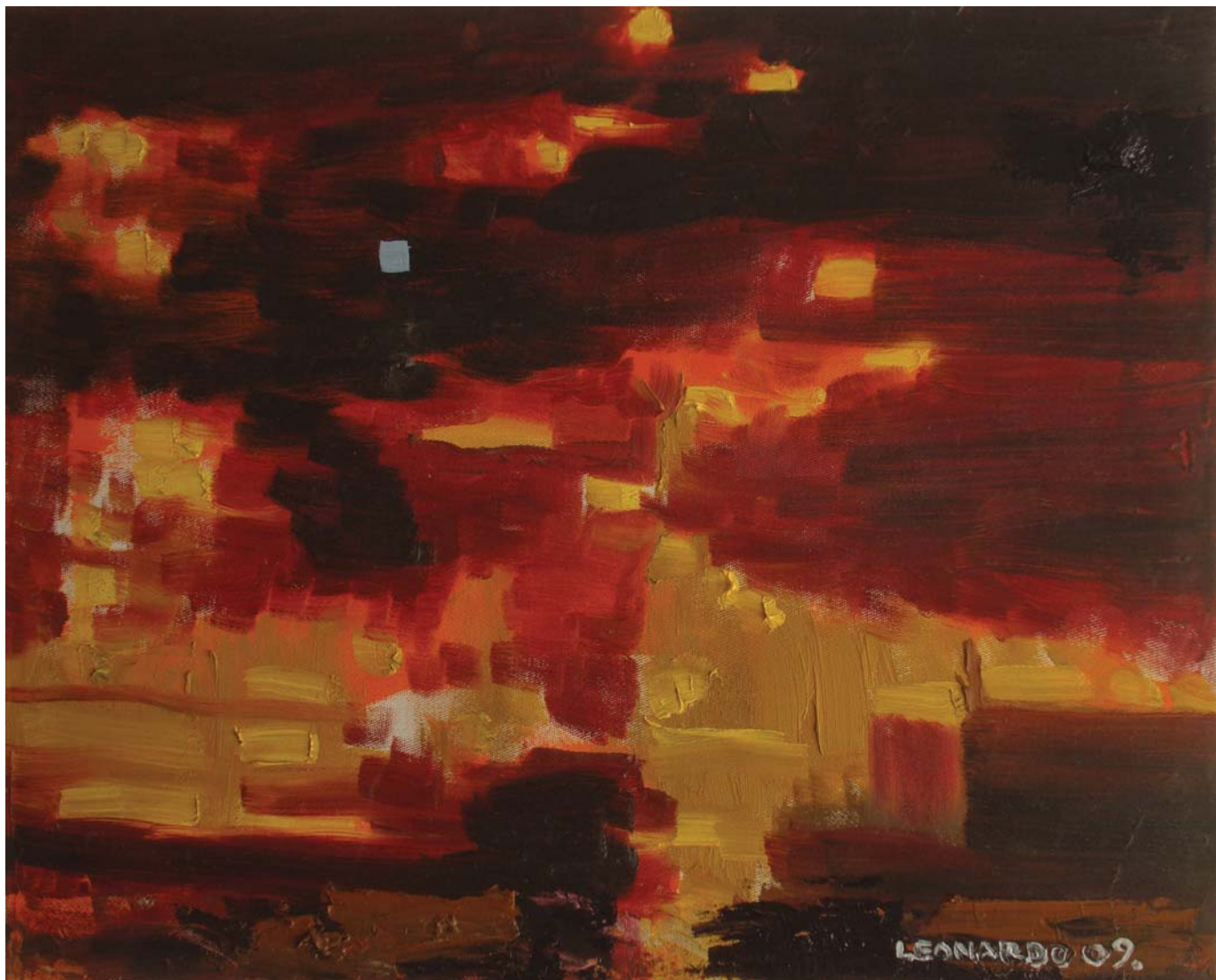
PLAVI PROZOR, 2009. ulje na platnu, 40x50 cm