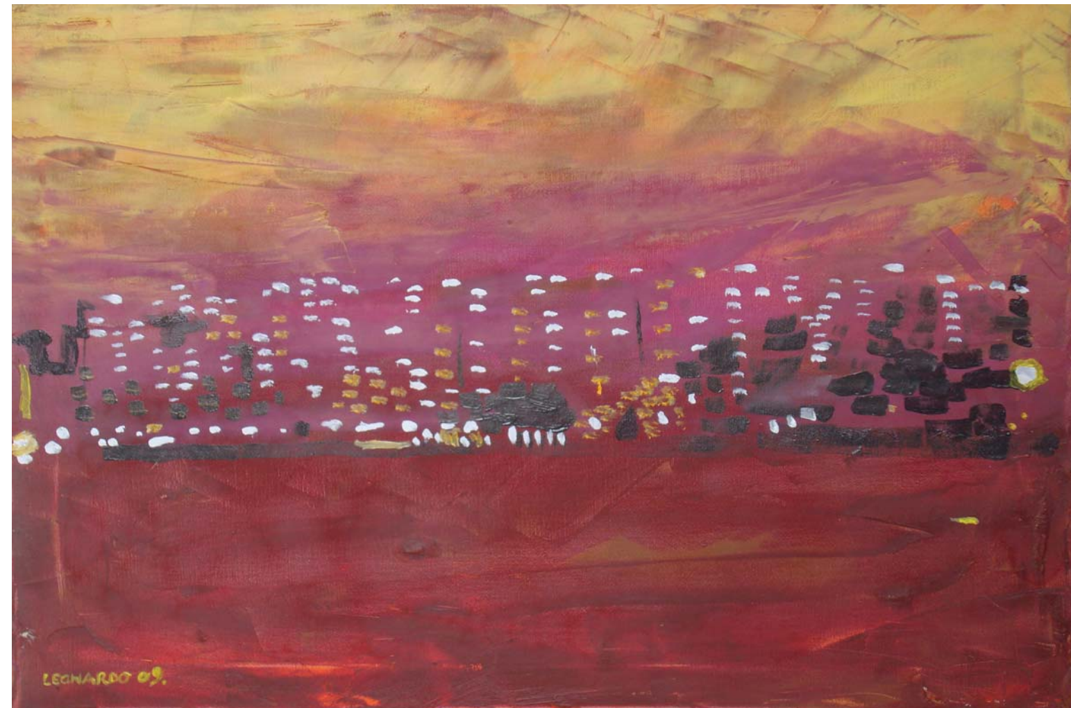
NOĆNA MAMUTICA, 2009. ulje na platnu, 50x70 cm