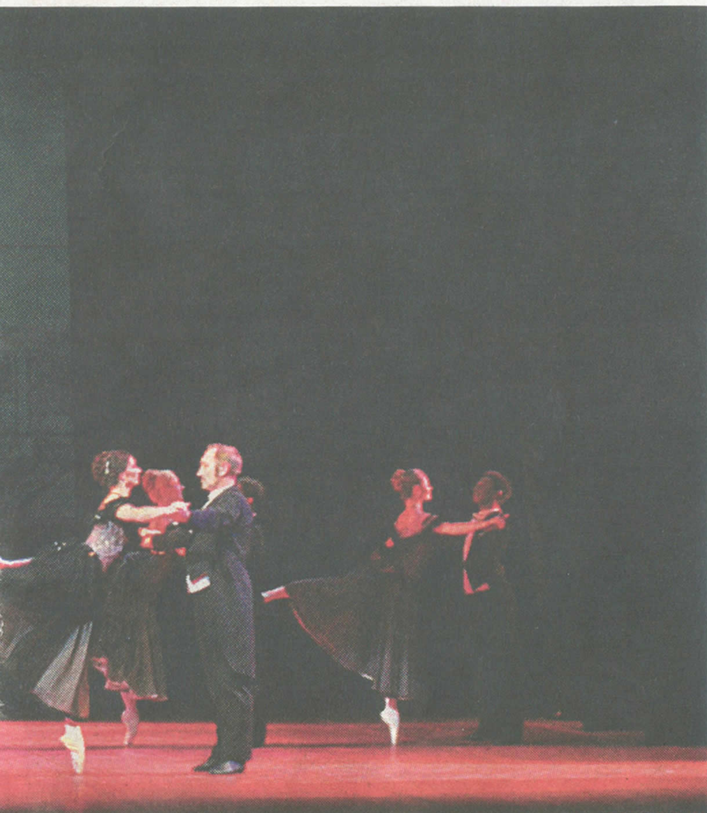
ARHIVA HNK ZAJC