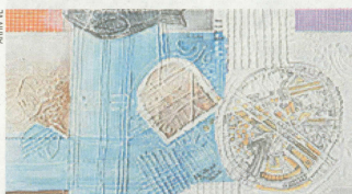
Iz ciklusa "Crtačeve preobrazbe"