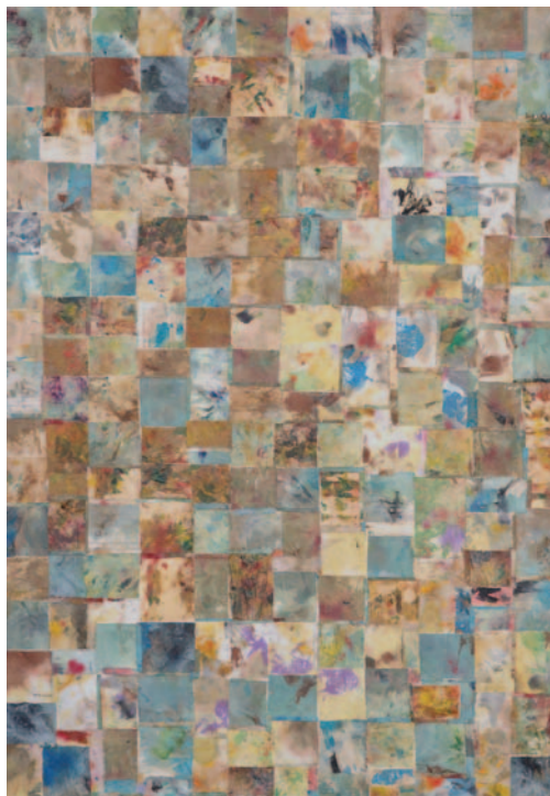
SILK WHITE, 2003. kolaž na platnu, 100x70 cm