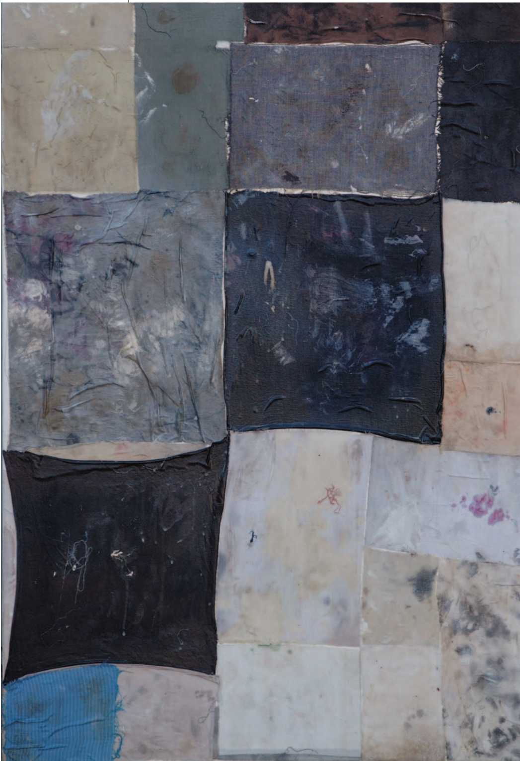
DISASTER BLUE , 2007. kolaž na platnu, 100x70 cm