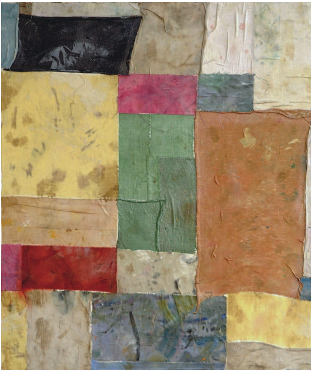
lijevo: BN, 2006. kolaž na platnu, 60x70 cm