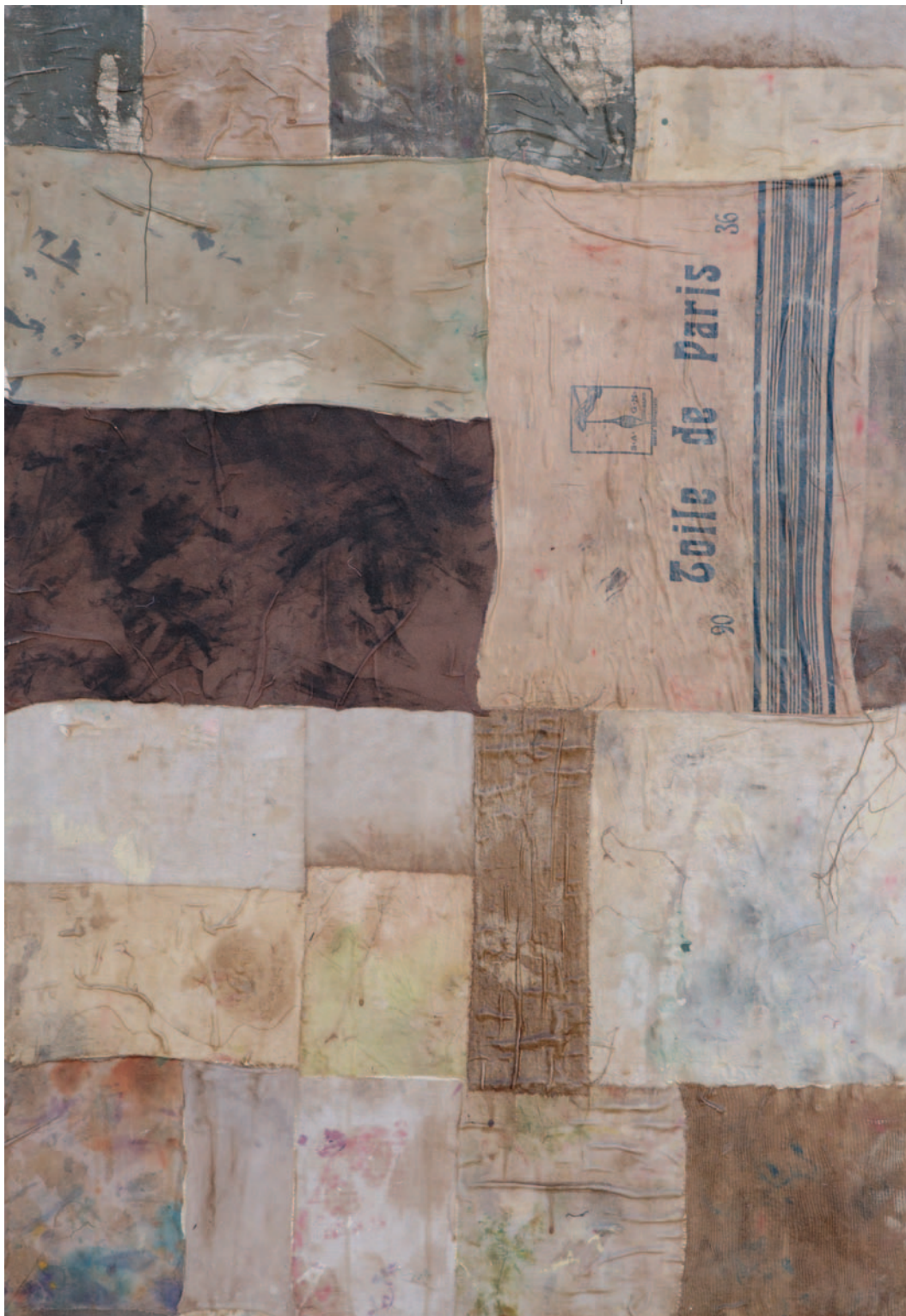
TOILE DE PARIS, 2007. kolaž na platnu, 100x70 cm